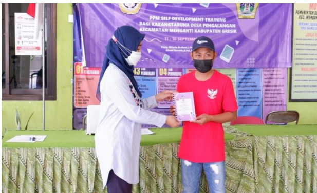
Gambar 4. Aktivitas selama pelatihan Self Development Training