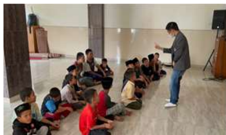
Gambar 11. Trainer 2