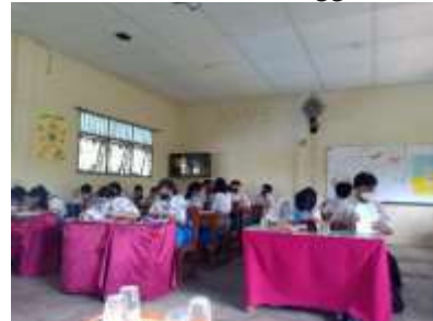
Gambar 4. Kelas 11 tanggal 11 Mei 2022