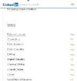
Gambar 2. Hasil survei keterampilan menurut LinkedIn

Berkomunikasi secara professional pun tercermin pada survei yang dilakukan sebuah jejaring sosial profesional LinkedIn ketika memaparkan keterampilan apa saja yang dibutuhkan dunia kerja tahun 2021 berikut ini: