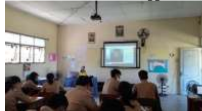
Gambar 5. Kelas 12 tanggal 12 Mei 2022