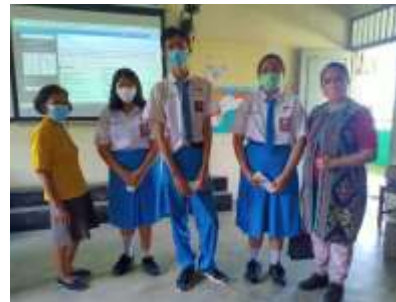
Gambar 3. Kelas 10 tanggal 10 Mei 2022