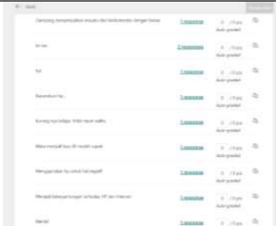
Gambar 1. Hasil survei pada pre-test April 2022

Untuk itu, dirasakan perlu bagi pengajar komunikasi untuk berbagi ilmu serta keterampilan dengan gen Z tentang komunikasi professional, yaitu komunikasi efektif, efisien, patut dan tepat.