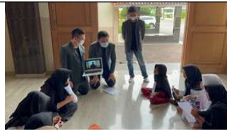
Gambar 12. Trainer 3