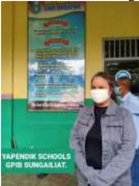
Gambar 9. Visi misi sekolah Harapan dibawah Yapendik GPIB