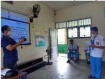
Gambar 8. Contoh kegiatan praktek 2