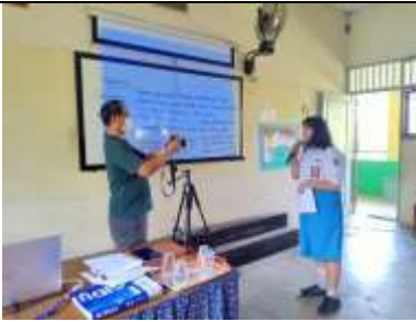
Gambar 7. Contoh kegiatan praktek 1