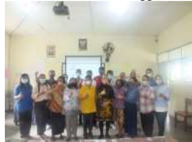
Gambar 6. Kelas Guru tanggal 13 Mei 2022