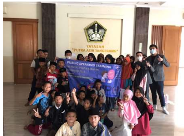
Gambar 13. Peserta pelatihan di panti asuhan

Sementara berikut ini adalah video dokumentasi bersama mitra 2: