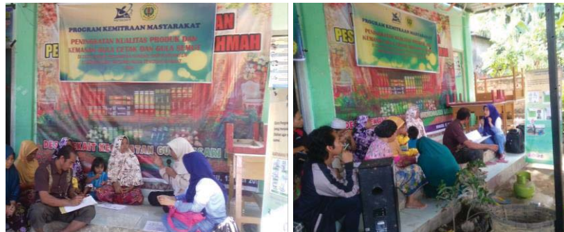
Gambar 1. Penyampaian Materi CPPB

Mitra dijelaskan mengenai berbagai kontaminan yang mungkin dapat terjadi selama persiapan maupun selama produksi. Selain itu mitra juga dijelaskan mengenai pentingnya sanitasi diri, sanitasi peralatan produksi dan sanitasi lingkungan produksi. Agar materi penyuluhan yang disampaikan dapat dipahami dengan mudah, materi disajikan dalam bentuk poster dan leaflet mengenai cara pengolahan pangan yang baik agar pemahaman mitra semakin meningkat (Gambar 1).