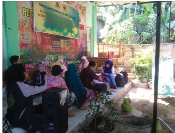
Gambar 3. Diskusi dengan Mitra

menunjukkan betapa pentingnya informasi dan pemahaman bagi para pelaku usaha bergerak di industri pengolahan pangan terutama skala rumah tangga maupun skala kecil mengenai cara pengolahan pangan yang baik.