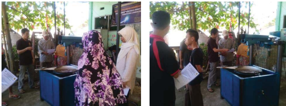
Gambar 4. Penyampaian Materi Cara Mengoperasikan Mesin Pengaduk Gula

Selain dilakukan kegiatan penyuluhan, para peserta juga diberikan pelatihan produksi gula semut melalui alih teknologi. Teknologi yang diintroduksi kepada peserta yaitu mesin pengaduk/pembuat gula semut. Pada kesempatan tersebut, peserta terlebih dahulu diperkenalkan mengenai fungsi dan bagian-bagian alat tersebut. Selanjutnya peserta diberikan penjelasan bagaimana tata cara mengoperasikan alat tersebut sesuai dengan keamanan (Gambar 4). Setelah peserta diberikan penjelasan singkat, selanjutnya peserta dilatih mengoperasikan dan membuat gula semut menggunakan alat tersebut seperti yang disajikan pada Gambar 5.