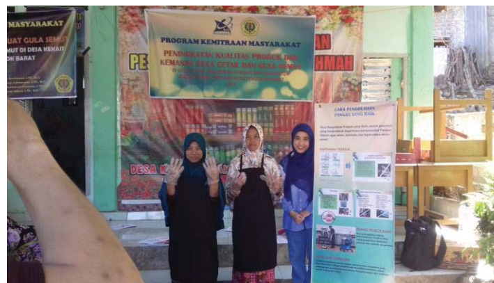
Gambar 2. Peragaan Penggunaan Pakaian Kerja

Selain itu juga diperagakan penggunaan pakaian kerja yang baik agar mitra memahami dan menerapkan materi yang telah disampaikan (Gambar 2). Karyawan yang bekerja harus menjaga badanya, mengenakan pakaian kerja yang bersih seperti celemek, penutup kepala, masker atau sepatu kerja, dan dalam keadaan yang sehat, selalu mencuci tangan dengan sabun sebelum memulai kegiatan mengolah pangan (BPOM, 2003). Dengan menerapkan CPPB maka produk yang dibuat oleh mitra akan terhindar dari kontaminasi.